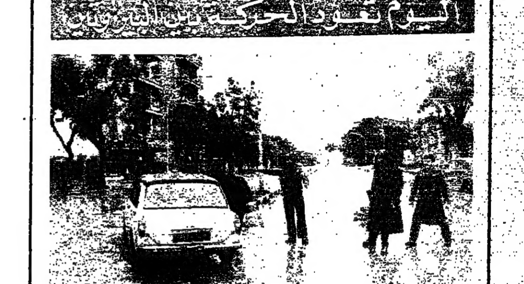
قوات الردع تحول السير عن طريق الزرعة - المتحف

بريجنيف يتوسط بين السودان وأثيوبيا تسلم الرئيس السوداني جعفر نمري رسالة من لوبوند بريجنيف الأمين العام للحزب الشيوعي السوفياتي. وقام بتسليم الرسالة للرئيس السوداني منسق الاتحاد السوفياتي في الخرطوم. ويحتفل ان يكون بريجنيف يحاول التوسط بين السودان وأثيوبيا بعد التوتر في العلاقات بينهما. دمشق - سانا